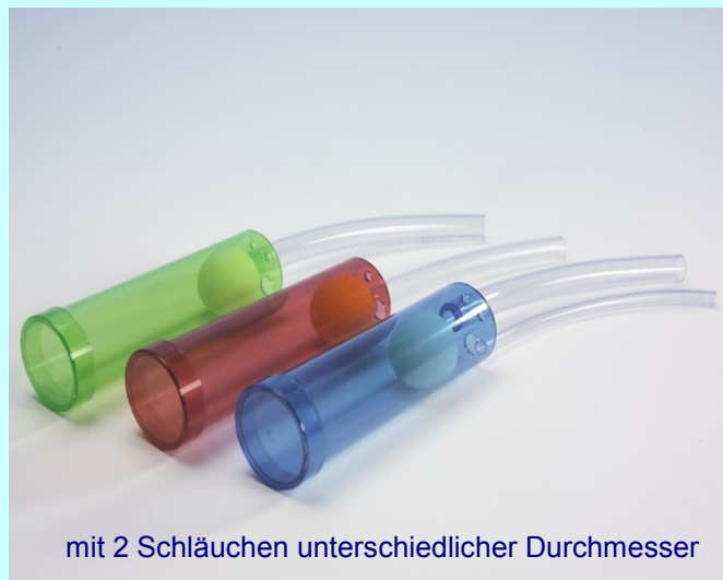
mit 2 Schläuchen unterschiedlicher Durchmesser